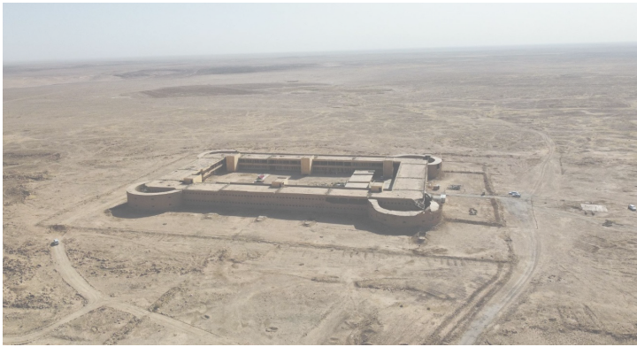
بەنديخانەى نوئى قەلاى نوگرە سەلمان

لە سالى ۱۹۷۵ تاكو ۱۰ كانوونى دووهم ۱۹۸۳ قەلاى نوئى نوگرەسەلمان لە دوو نھۆم و چوار بورجى چاودىرى دروست كرا، ديزاينى قەلاكە نەك بۆ بەنديخانە بەلكو بۆ پۇلىسى بيابان و سەرسنور دروستكرا بوو و دواتر بوو بە بەنديخانەيەك كە دەرباز بوون لىي زياتر لە خەون دەچوو. بروانە وينەى خوارەوہ.